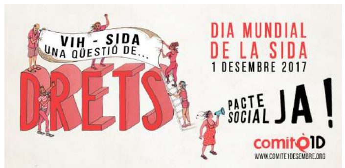
Imatge gràfica DMS 2017

Es va comptar amb un photocall i materials per a la difusió d'imatges a la xarxa.